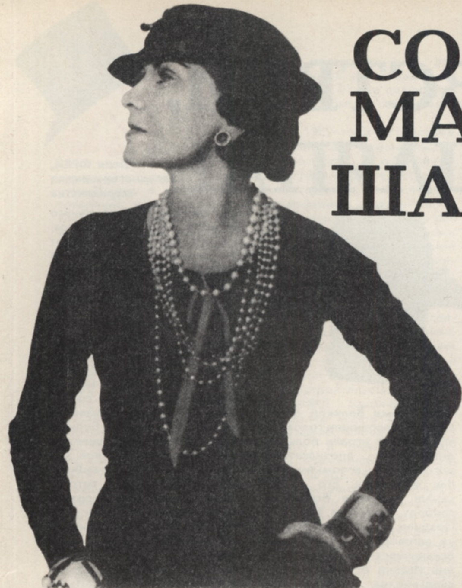
Габриэль (Коко) Шанель, создательница международного стиля в моде: «Модно то, что ношу я».

Ф игура важнее, чем лицо, и важнее фигуры средства, которыми ее сохраняют. Но важнее всего жизнерадостность, соответствующая темпераменту, а ее сохранишь, только имея хорошее здоровье.